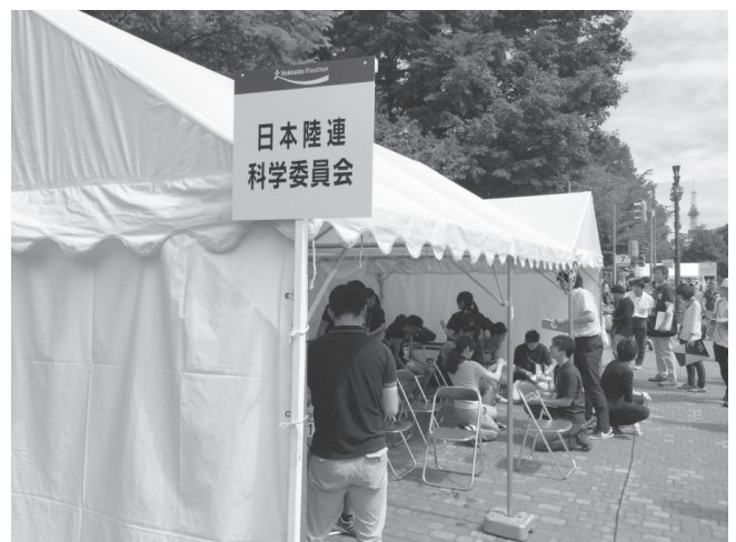
写真1 ゴール後の測定場所（テント内）

気象状況は、我々がWBGT計を用いて計測した（写真4）データを図1に示した。スタート時には約25度前後、湿度は約46%を示したが、時間経過とと