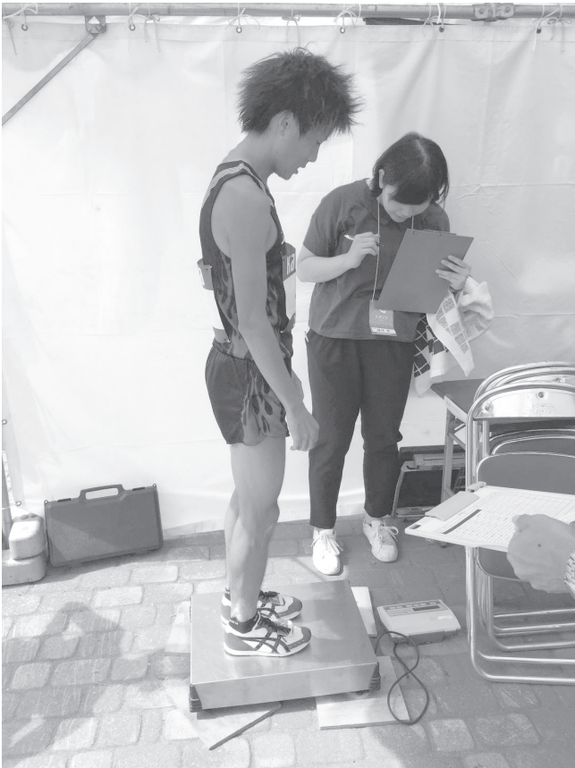
写真2 ゴール後の体重測定の様子