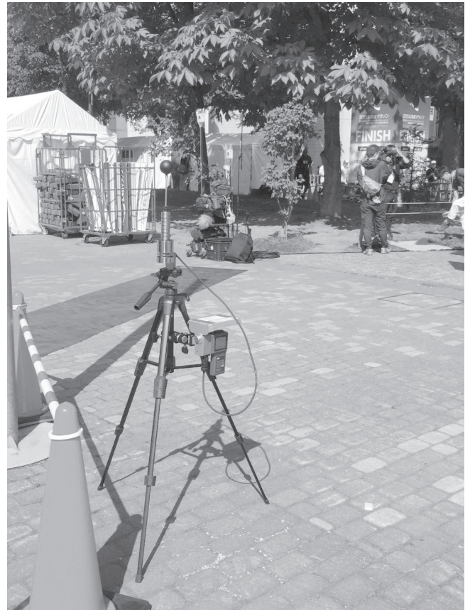
写真4 ゴール付近の環境データ計測の様子